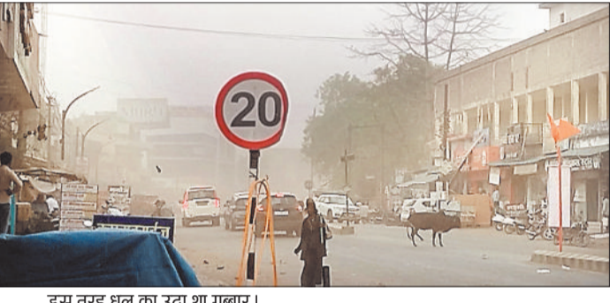
इस तरह धूल का उठा था गुबार।