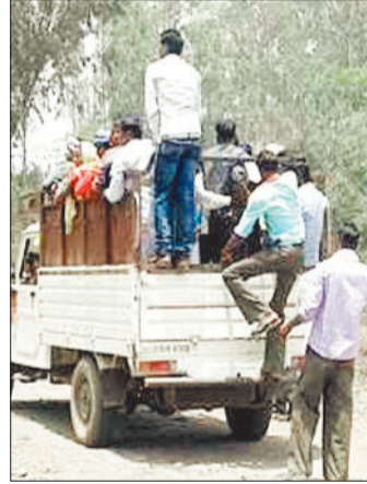
मालवाहक वाहन में सवार लोग।

मालवाहक वाहनों में सवारी ढोना चालकों को महंगा पड़ गया। इस मामले में कार्रवाई करते हुए वाहन चालकों से 15 हजार का जुर्माना वसूल किया गया है। यातायात पुलिस ने तीन सवारी सहित यातायात नियमों का पालन करने की समझाईश दी है। इस संबंध में मं मली जानकारी के अनुसार यातायात पुलिस जांजगीर-चांपा द्वारा मालवाहक वाहनों में सवारी बैठाकर परिवहन करने वाले वाहन चालकों के विरुद्ध सख्त कार्रवाई की गई। विशेष चेंकिंग अभियान के दौरान ऐसे वाहन चालकों पर निगरानी रखी गई जो नियमों का उल्लंघन करते हुए मालवाहक वाहनों में लोगों को बैठाकर यात्रा करा रहे थे। यातायात चेंकिंग