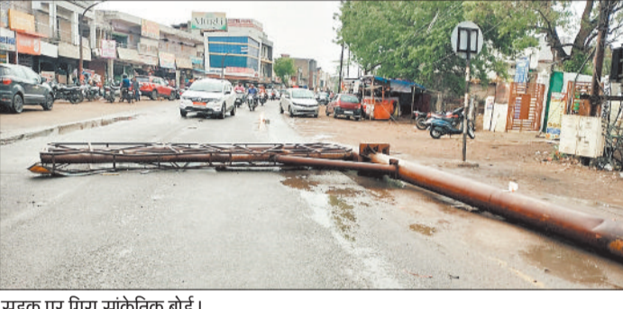
सड़क पर गिरा सांकेतिक बोर्ड।