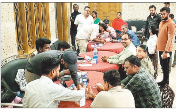
शिविर का लाभ उठाते समाज के लोग।

महिला मंडल के संयुक्त तत्वावधान में अग्रसेन भवन कटघोरा में विशाल निःशुल्क स्वास्थ्य जांच एवं परामर्श शिविर का आयोजन किया गया। इस शिविर का मुख्य उद्देश्य क्षेत्र के लोगों को स्वास्थ्य के प्रति जागरूक करना तथा उन्हें विशेषज्ञ चिकित्सकों से निःशुल्क जांच और परामर्श उपलब्ध कराना था। इस स्वास्थ्य शिविर में कटघोरा, कोरबा, पाली सहित आसपास के क्षेत्रों से बड़ी संख्या में लोग पहुंचे और शिविर का लाभ उठाया। कुल 115 लोगों ने इस शिविर में अपनी स्वास्थ्य जांच करवाई तथा विशेषज्ञ चिकित्सकों से परामर्श प्राप्त किया। शिविर में आए मरीजों को विभिन्न प्रकार की महत्वपूर्ण स्वास्थ्य जांच