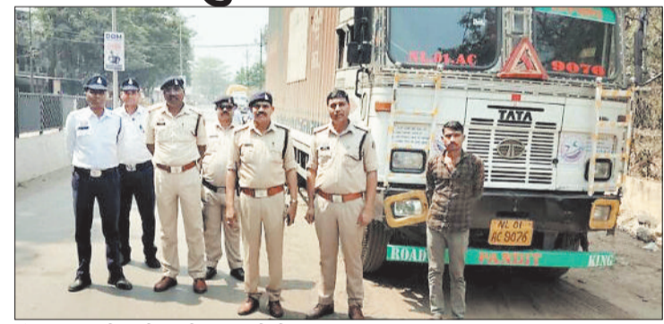
ट्रेलर वाहन की जब्ती करती पुलिस की टीम।

शहर के इंदिरा स्टेडियम से लेकर सीएसईबी चौक में ट्रेलर चालक लगातार मनमानी कर रहे थे और सड़क के किनारे