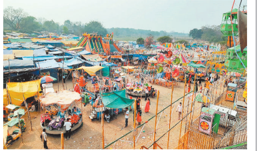
जांजगीर-चांपा। रंगपंचमी से प्रारंभ हुए पीथमपुर मेला इन दिनों पूरे शबाब पर है। लोग बाबा कलेसरनाथ के दर्शन करने के साथ साथ मौत का कुआ, झूला सहित अन्य मनोरंजन के साधनों का आनंद ले रहे हैं।